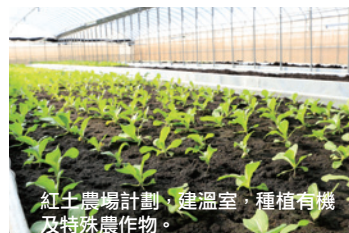
紅土農場計劃，建溫室，種植有機及特殊農作物。

因應時代演變及學生增加的需求，全校活化校產使用，增建學生宿舍，展現新氣象的步調加快，王茂駿現階段推動校務的三大主軸包括：一、設定願景、擬定目標，推動中長期校務發展計畫，二、啟動校園整體規劃，三、力行精實管理計畫，提高行政管理效能。