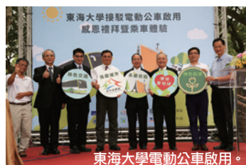
東海大學電動公車啟用。